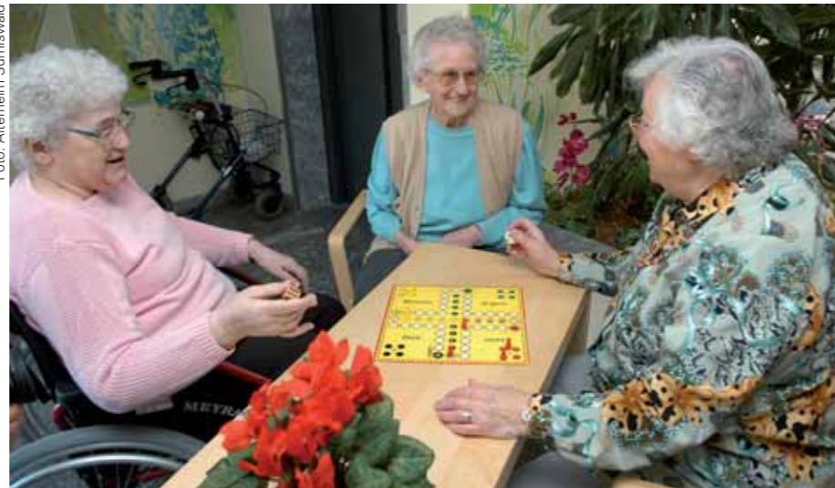
«Beim Spiel kann man einen Menschen besser kennen lernen als im Gespräch in einem Jahr.» (Platon)